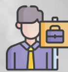
Formació i orientació laboral