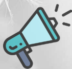
Sistemes augmentatius i alternatius de comunicació