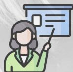
Suport a la intervenció educativa