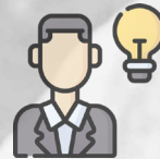
Empresa i iniciativa emprenedora