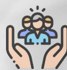
Atenció a unitats de convivència