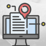
Projecte d'intervenció social