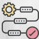
Metodologia de la intervenció social