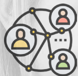
Context de la intervenció social